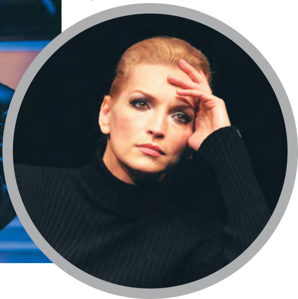
▲ Аглаоника – Н. Благих. «Орфей», 2011 г.

Наумович и делал такой уничтожающий разбор, мог так отозваться о твоей работе, что всю жизнь будешь помнить, но уж если хвалил, то это дорогого стоило. После окончания мы еще год играли спектакли в качестве стажеров в «Мастерской Фоменко» – семь спектаклей очень хорошего, не студенческого уровня.