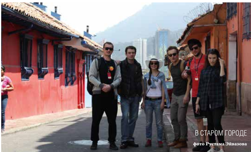
В СТАРОМ ГОРОДЕ

В Боготе меня повсюду принимали за своего. Когда я заходил в магазин, охранки косо на меня смотрели, как на местного бандита-мафиози: здоровый, в черных очках. Так что я сопровождал наших девушек-актрис на прогулках, со мной им было совсем не страшно.