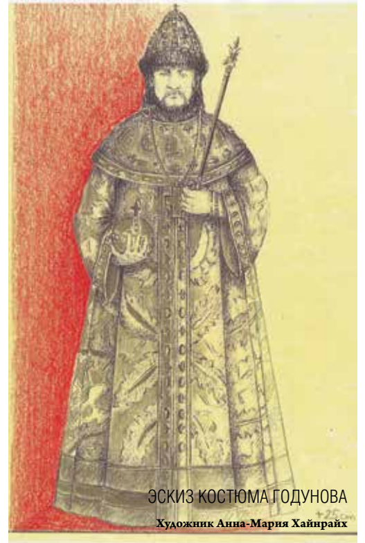
ЭСКИЗ КОСТЮМА ГОДУНОВА

У него не было никаких документов, но у него был дар провидения, и он писал ту историю, которую удастся открыть только через много лет, и в своем анализе истории он оказался более точным, чем Карамзин. Рядом с реальными историческими фигурами он ставит вымышленных – редчайший случай. Афанасия Пушкина и молодого Курбского нет у Карамзина. Афанасий Пушкин – придуманная фигура, причем Пушкин этому вымышленному персонажу дает свое собственное имя. У Карамзина есть Курбский, тот знаменитый исторический Курбский, о котором Пушкин потом захочет написать целую пьесу, но, к сожалению, не напишет. Все свои основные мысли Пушкин отдает Пимену, ведь поэт должен быть летописцем, – так считал Пушкин.