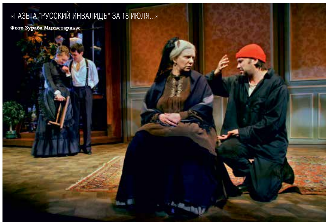
«ГАЗЕТА "РУССКИЙ ИНВАЛИД" ЗА 18 ИЮЛЯ...»