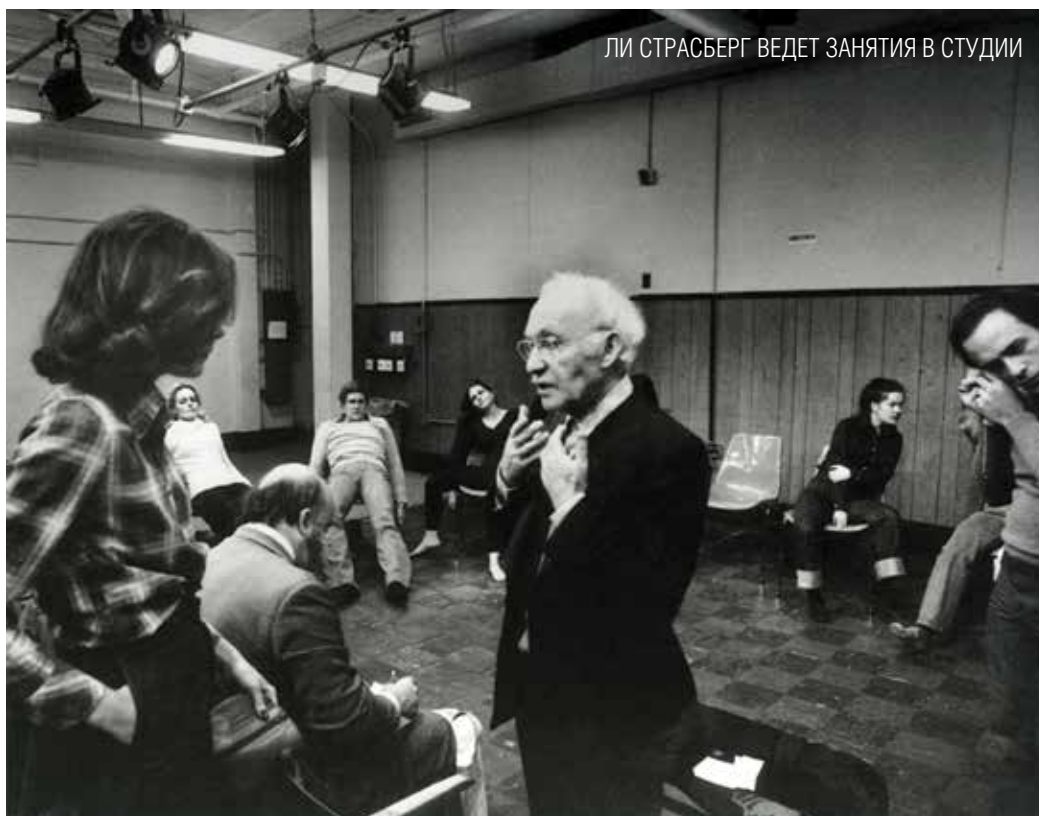
ЛИ СТРАСБЕРГ ВЕДЕТ ЗАНЯТИЯ В СТУДИИ

Как известно, все нью-йоркские представления предваряли лекции Ричарда Болеславского, актера МХТ, исполнявшего Беляева в Тургеневском спектакле «Месяц